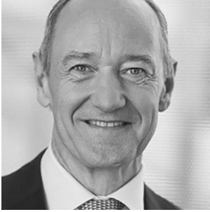
Dr. Roland Busch CEO and President, Siemens AG

Roland Busch ist Vorstandsvorsitzender der Siemens AG, einem Technologieunternehmen, das daran arbeitet, das Rückgrat unserer Volkswirtschaften zu transformieren: Industrie, Infrastruktur, Mobilität und das Gesundheitswesen. Er begann seine Karriere bei Siemens, weil er davon begeistert ist, wie Technologie dabei helfen kann, die großen Herausforderungen unserer Zeit zu lösen. Von agileren Fabriken über intelligente Gebäude und Stromnetze bis hin zu nachhaltigem Transport und